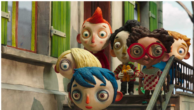
Ma vie de courgette de Claude Barras Rita Productions - Blue Spirit Productions - Gebeka Films - KNM - RTS SSR - France 3 Cinéma - Rhones-Alpes Cinéma - Helium Films

Comme pour la lecture ou la visite des musée, l'offre cinéma est débordante pendant cette période – et souvent gratuite ou à moindre coût. Le Centre Nationale du Cinéma et de l'image animée a réalisé un dossier très complet à ce sujet avec une orientation résolument éducative et pédagogique.